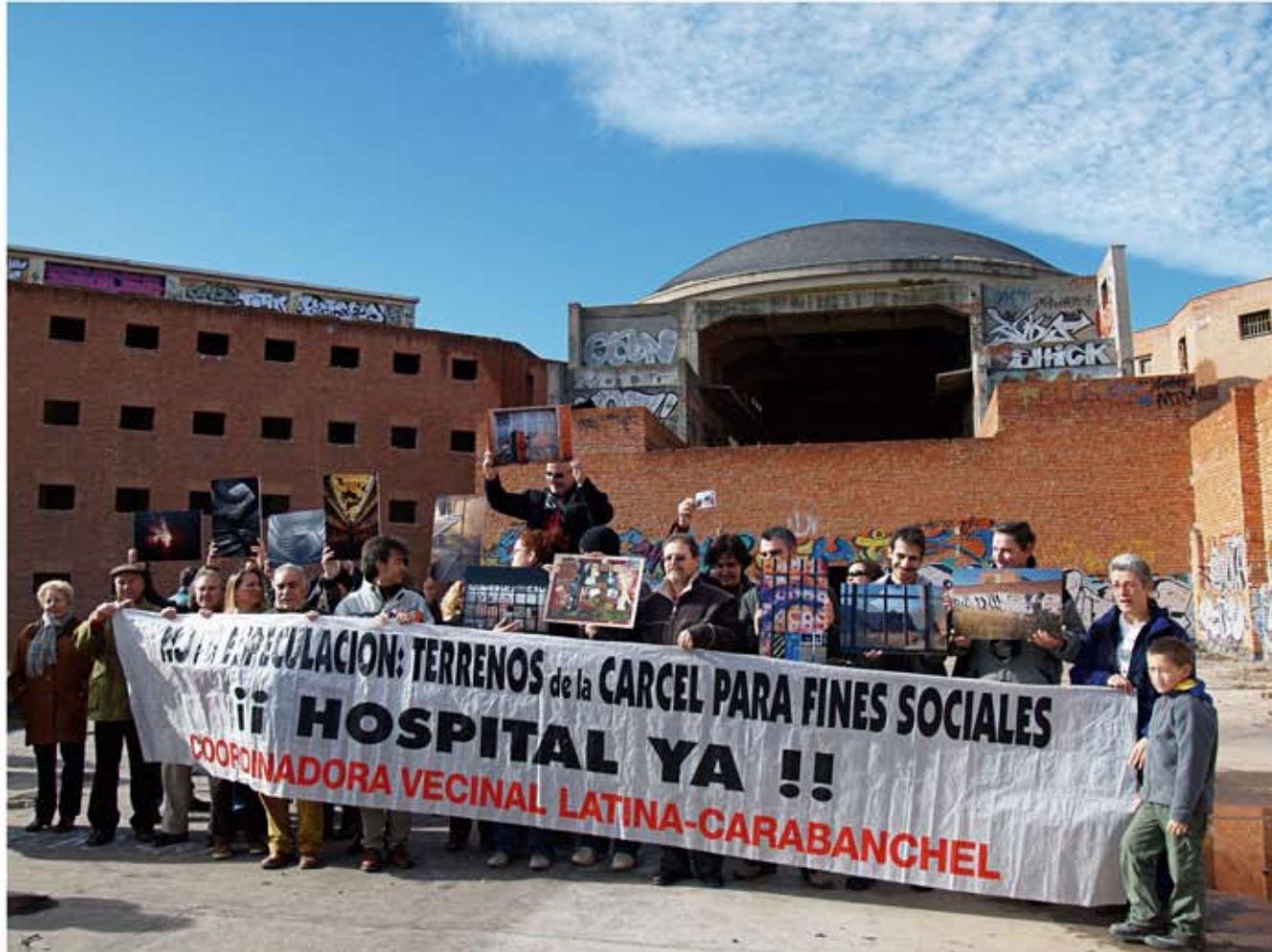
Los vecinos y los rotograros presentaron la exposición ante los medios de comunicación el 14 de enero del 2008 en la misma cárcel de Carabanchel.