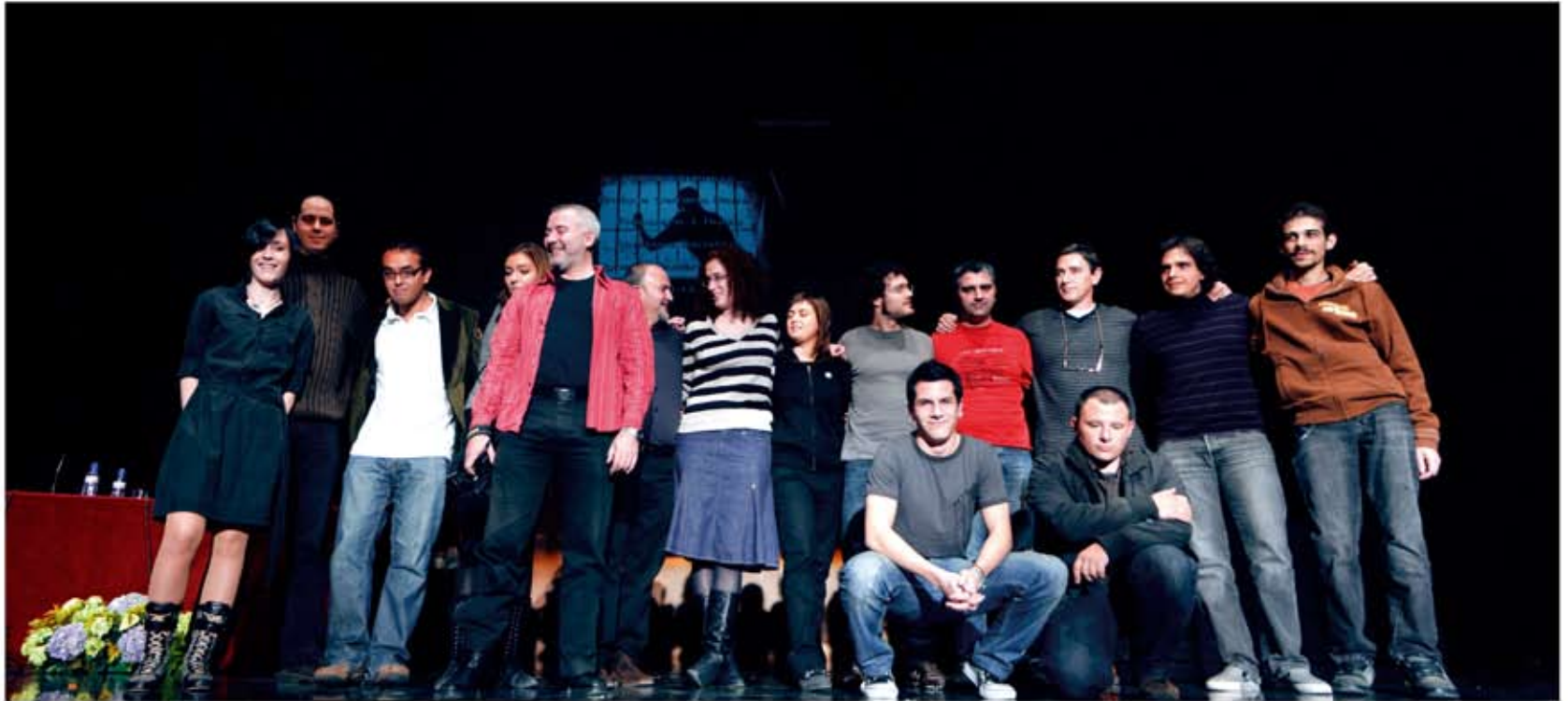
Los fotógrafos en la inauguración de la primera exposición. Madrid 18-01-2008.